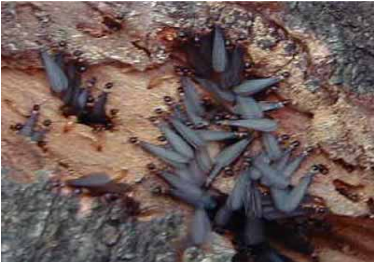
ヤマトシロアリ(岐阜県で家屋を加害する種類)とその羽蟻の写真です。